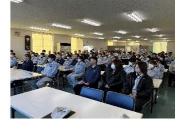
忘年会アンケート

忘年会に参加して頂いた方にアンケートお願いしています。お店で開催するにしても人数に制限があるため社内で開催する可能性が高く、今後の参考にしたいため協力をお願いします